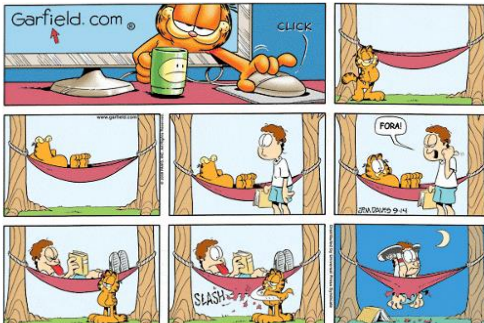
Tirinha Garfield, de Jim Davis

impessoal, tornando-se carregada de afetividade. A locução “dia a dia”, por fim, além de reiterar simetricamente a ideia de um casal em uma relação de parceria já presente no início da frase, acrescenta a noção de constância: o “casamento” da empresa com o consumidor não é apenas duradouro, mas também constante.